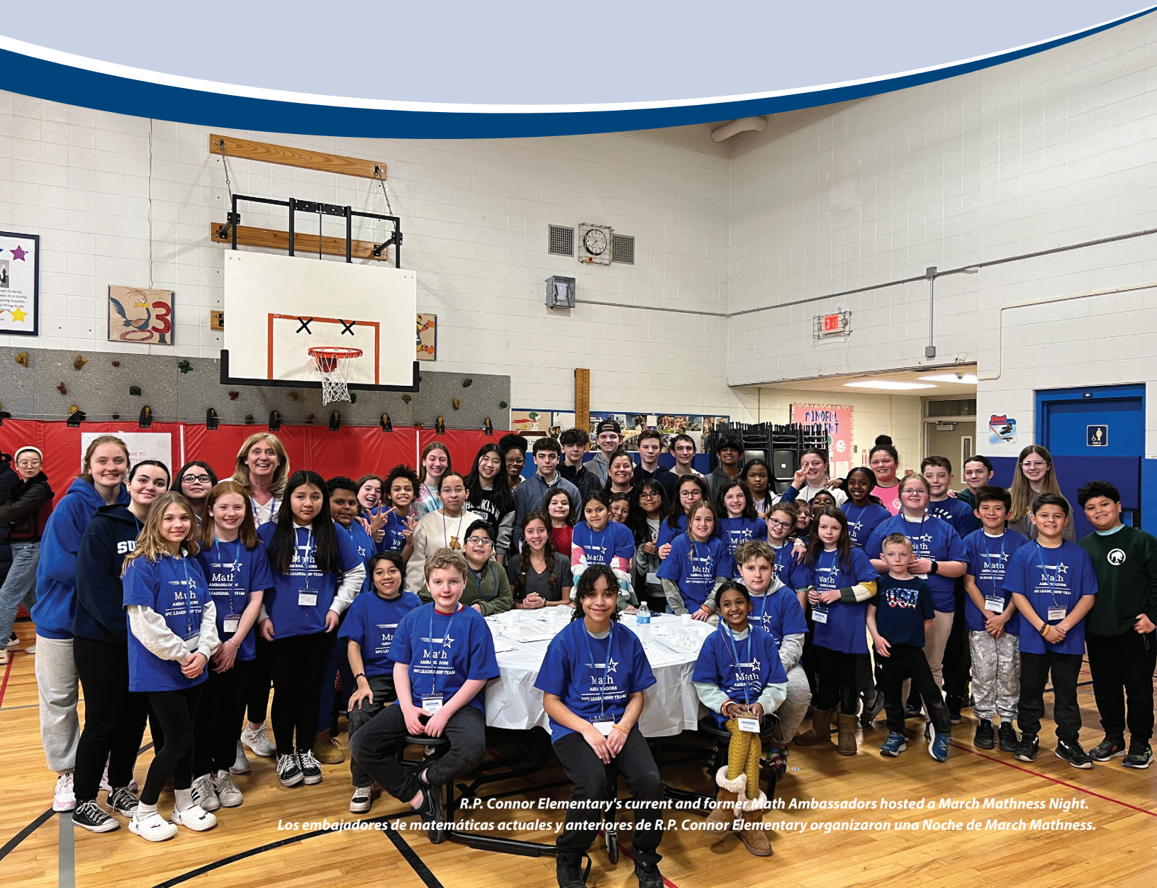
R.P. Connor Elementary's current and former Math Ambassadors hosted a March Mathness Night. Los embajadores de matemáticas actuales y anteriores de R.P. Connor Elementary organizaron una Noche de March Mathness.